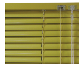
Obj. kód HZM Klasická horizontální žaluzie s řetězovým ovl.