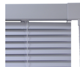
Obj. kód HZE Klasická horizontální žaluzie